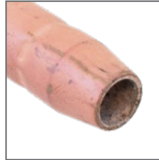
BUSES PRÉ-ENDUITES E-WELD MC