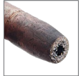
BUSE RÉGULIÈRE OEM COMPLÈTEMENT BOUCHÉE