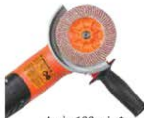
Après 100 min.*