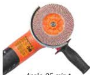
Après 35 min.*