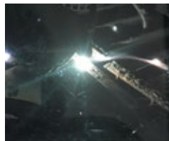
Lentille HD Lentille ArcOne HD

Voyez les couleurs sous leur forme la plus réelle grâce à la technologie HD exclusive d'ArcOne. Cette caractéristique innovante disponible avec les masques ORBIT MC augmente la plage de lumière visible à travers la lentille de soudage. Cela signifie que vous verrez des couleurs plus naturelles, ce qui vous permettra d'avoir une vue plus claire et mieux définie de votre zone de travail.