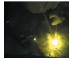
Non HD Lentilles de la concurrence